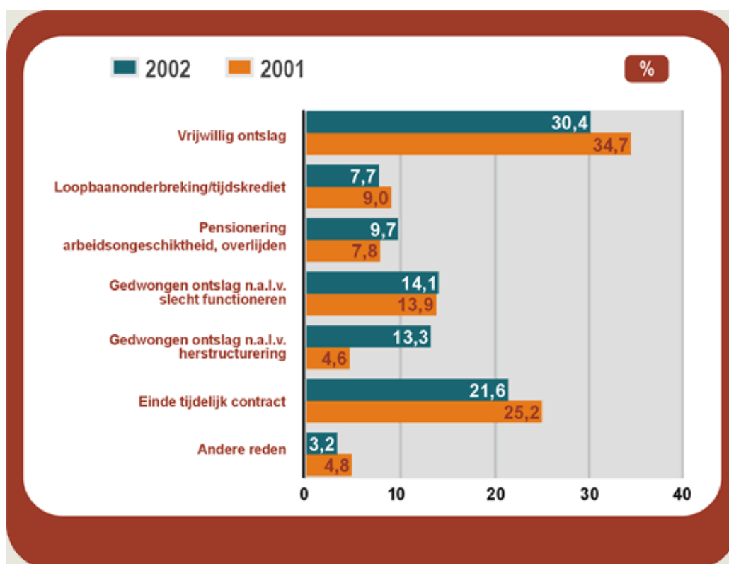
Figuur 3 Uitstroom naar reden bij de organisaties met 10 werknemers of meer (gewogen naar sector en grootte), gemiddelde van de aandelen over alle vertrokken werknemers, vergelijking 2001 en 2002